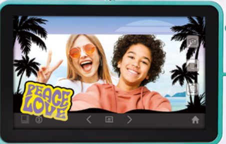
PHOTO / VIDEO

Accéder à des milliers de sites web et de contenus ludo-éducatifs en toute sérénité.